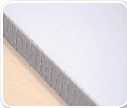
Einstellbare Fräs- und Schlitztiefe