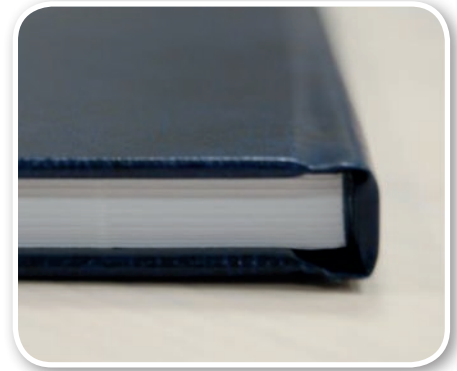
Hardcover – Klebebindung