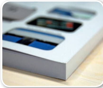
Softcoverbindung mit perfekt geformten Rücken