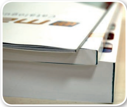
Klebebindung von 1 bis zu 50mm