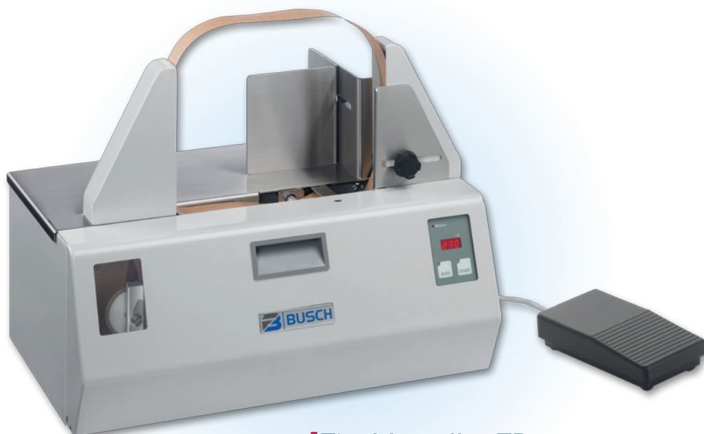
Tischbündler TB 26

Der Rollenwechsel ist mit wenigen Handgriffen erledigt.