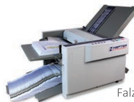
Falzmaschine TF MEGA-A