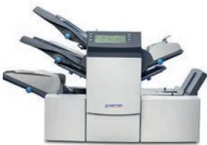
Kuvertiermaschine SI 3350