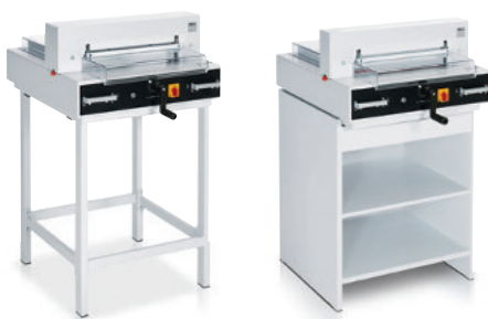
Untergestell optional Unterschrank optional