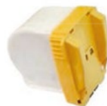
5035 oder 5050

2 bzw. 4 Drahtheftköpfe mit 2 kg Drahtspulen