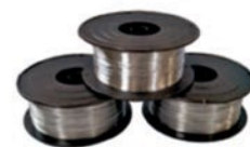
5035S oder 5050S

2 bzw. 4 Drahtheftköpfe mit 2 kg Drahtspulen