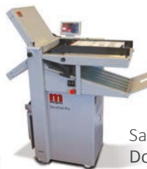
Saugluft-Falzmaschine Docufold Pro