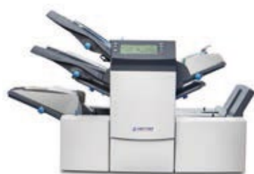
Kuvertiermaschine SI 3350