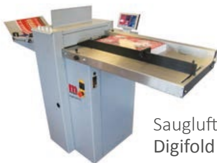
Saugluft-Rill- und Falzmaschine Digifold Pro