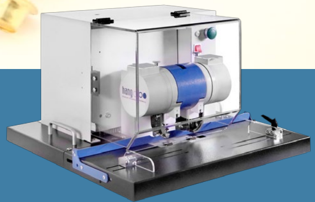
Doppelösmaschine PiccoStar 102-60