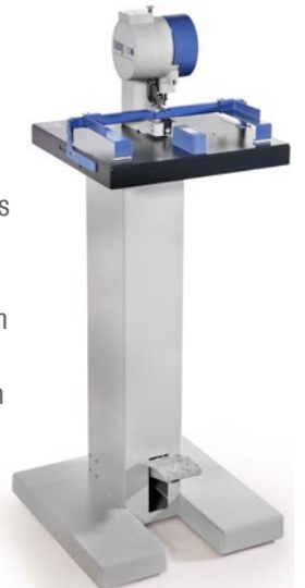
Modell 102-20 / 102-28