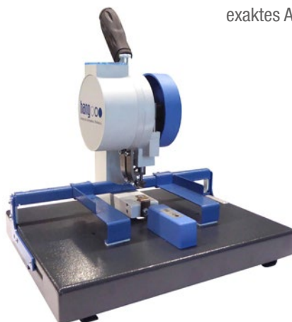
Modell 102-10 / 102-14