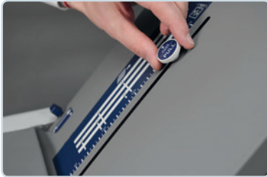
Manuelle Einstellung der Falztaschen