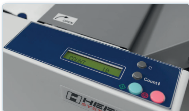
Display mit 4-stelligem Zähler, Vorwahlzähler und Statusanzeige