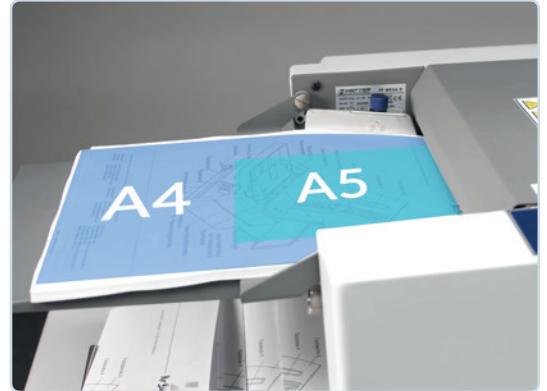
Falzbare Formate sind DIN A4 und DIN A5