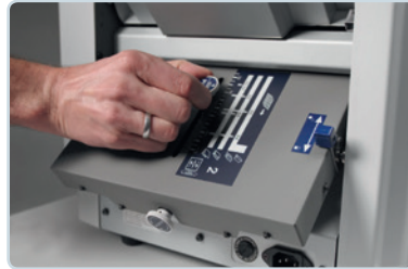
Manuelle Einstellung der Falztaschen auf der Rückseite