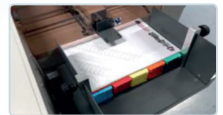
Einstellung des Anlegers mit magnetischen und verschiebbaren Anschlägen