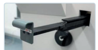
Einfacher Werkzeugwechsel in weniger als 2 Minuten

www.walter-mackh.de | Online-Shop Maschinen und Materialien für die Druckweiterverarbeitung.