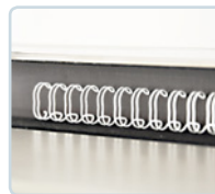
Magnetleiste zur Positionierung der Drahtbinderücken