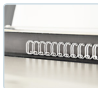
Magnetleiste zur Positionierung der Drahtbinderücken