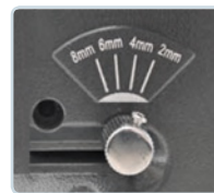
schnelle Einstellung der Stanztiefe (von Blattrand)

www.walter-mackh.de | Online-Shop Maschinen und Materialien für die Druckweiterverarbeitung.