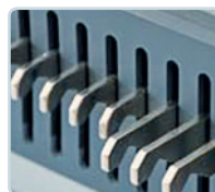
einzel deaktivierbare Stanzstempel