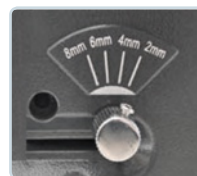
schnelle Einstellung der Stanztiefe (von Blattrand)