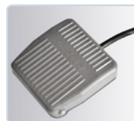
elektrische Stanzung über Fußschalter