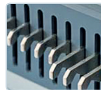
einzel deaktivierbare Stanzstempel